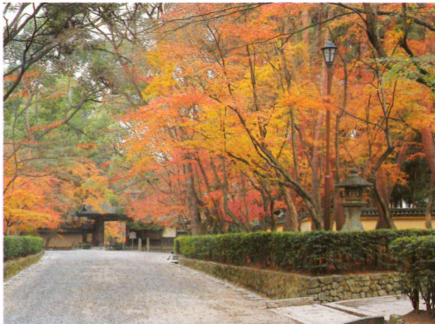
參道と総門 / 參道和總門 / 로쿠온지 절 정문으로 가는길 / The approach to the main gate.