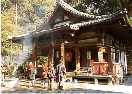
不動堂 / 후도도 불당 / Fudo-do, a hall dedicated to the God of Fire

본존은 고보(弘法)대사가 제작했다고 전해 내려오는 석부동명왕(石不動明王)으로서, 영험을 가진 비불(秘佛)로 널리 서민신앙의 대상이 되고 있습니다. 춘분과 8월16 일에는 개방 법회가 개최 됩니다.