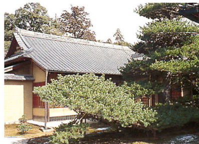
陸舟之松 리쿠슈노마쓰 소나무 An old pine tree, Rikushunomatsu

방장(方丈=주지의 방)의 북쪽에는 교토 3대 소나무 중 하나로서 배의 모양을 본 뜬 「리쿠슈노마쓰(陸舟之松) 소나무」가 자리잡고 있으며 이 소나무는 요시미쓰(義滿)가 직접 심은 소나무라고도 전해지고 있습니다.