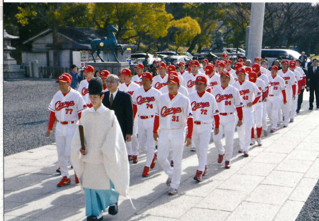
◀広島東洋カープ必勝祈願祭

■各種祈願祭／社頭では、毎日初宮詣・車祓・厄除・安産等の諸祈願を御奉仕しています。