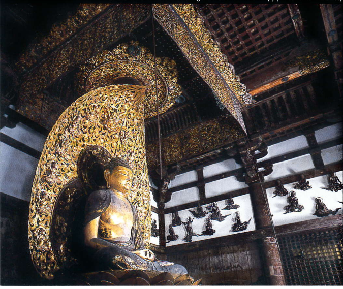
阿弥陀如来坐像と二重天蓋(国宝) Seated statue of Amitabha Tathagata and the twofold canopy (both national treasures)

극락정토의 궁전을 모델로 축조된 봉황당(鳳凰堂)은 중당(中堂)·좌우의 익랑(翼廊)·미랑(尾廊)으로 구성되어 있는 다른 곳에서 그 사례를 찾아볼 수 없는 건축물입니다. 당 내에는 헤이안 시대를 대표하는 불상정적, 조초(定朝)의 작품으로 판명되어 현존하는 유일한 불상인 본존아미타여래좌상(本尊阿弥陀如来坐像)을 비롯해 운중공양보살상(雲中供養菩薩像) 52구, 문과 벽에는 9가지 방법으로 아미타보살을 맞이하는 구품내영도 등 헤이안 시대·정토교 미술의 정수가 집약되어 있습니다. (현재, 운중공양보살상 26구는 호쇼관(鳳翔館)에 전시)