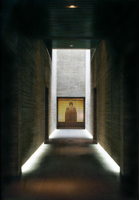
エントランス・格子越しに梵鐘(国宝) Museum entrance and Buddhist Temple-Bell (national treasure) behind latticework

보도인(平等院) 사찰은 1052년, 관백(關白) '후지와라 요리미치(藤原頼通)' 공이 창건 하였으며, 불황당은 그 다음해인 1053년에 아미타여래(국보)를 안치하는 아미타당(국보) 으로서 건립되었습니다. 정원은 정토(淨土)양식의 차경정원으로 사적명승정원으로 지정 되어 있으며, 현재, 불황당 주변에는 석가산과 주색칠을 한 다리 그리고 아치식다리, 작은 섬 등이 배치되어 있습니다. 그 밖에도 보도인 사찰에는 아마토에(大和繪)식의 구품내영도(국보), 범종(국보), 금동불향 1 쌍(국보) 등, 헤이안 시대의 문화재가 다수 보존되어 있습니다. 특히, 11세기의 불상군으로서 유일하게 현존하는 운중공양보살상 52구(국보)는 모두보살들이 구름을 타고, 여러 가지 악기를 연주하며 춤을 추는 조각상 등을 형식에 구애받지 않은 자유로운 모양으로 섬세하게 새겨져 있습니다.