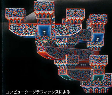
コンピューターグラフィックスによる 鳳凰堂内彩色復元 Depiction of Phoenix Hall with its colors restored by computer graphics