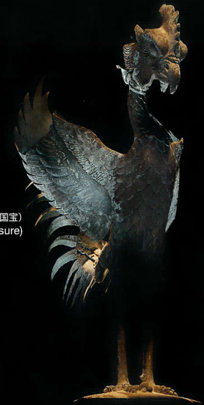
鳳凰1対(国宝) Pair of Phoenixes (national treasure)