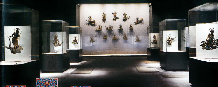
雲中供養菩薩26体(国宝) 26 statues of Worshipping Bodhisattvas on Clouds (national treasure)

호쇼칸은 범종, 금동불향 1쌍, 운중공양보살상 26구를 비롯해 보도인 사찰에 대대로 전해 내려오는 여러가지 보물을 보존하고 전시하는 박물관입니다. 또한 컴퓨터 그래픽을 사용한 영상전시와 초고정밀도의 섬세한 화상으로 불황당 내부를 자유롭게 검색할 수 있는 레퍼런스 시스템 등도 갖추고 있습니다.